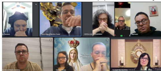
Grupo de membros do CAE em reunião